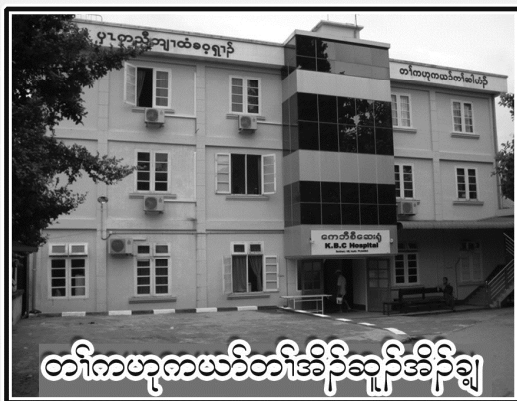
တော်ကဗုဒ္ဓကမ္ဘာပိဋိပဿီ