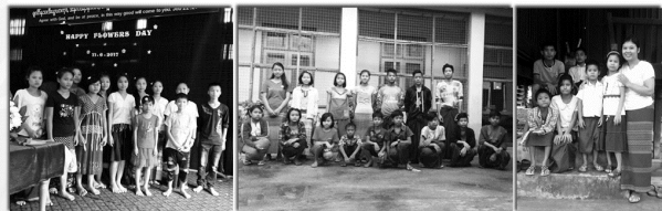
တော်ကဗုဒ္ဓကမ္ဘာပိဋိပဿီ