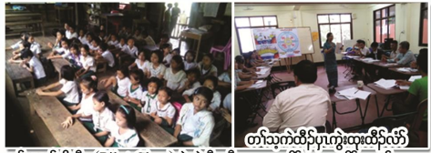
တံးမၤကွဲးဆိတံး (Pilot Class) စံးပုၤန့ၣ်ထံ အပတံးတၢၤတၢၤတက့ၢ်

တံးမၤသကိးတံးဒီးန့ၣ်ကယၤ ၂၁တံးတံးကျဲဒံပတံးတံးတံး တံးကျဲတံးကျဲတဖှ်