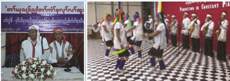
တံးကျဲတံးကျဲတံးကျဲ တံးဟ့ၣ်ထီၣ်ခဝုၣ်န့ၢ်ကတိး