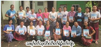
သမုၢ်တံးသ့လံာ်လံာ်တံးကျဲ