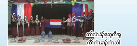
တံးလဲၤခဲၣ်ဖွဲဆူတံးအု ကီၢ်ကဲၤခဲၣ်ကဲၤခါ