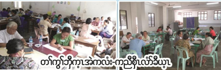
တံးကျဲတံးကျဲအကလံး-ကညိစ့ၢ်လံာ်လံာ်