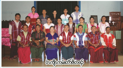
ဝဲကျဲကမ်းတံးစိတဖှ်