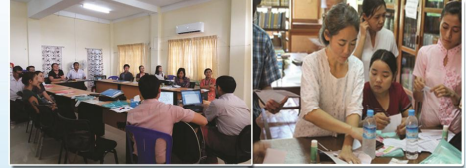
တံးယုထံအတံးမၤလိ တံးဟ့ၣ်သဆၣ်ထီၣ်ဒီးတံးဒုးအိၣ်ထီၣ် လံာ်နီၣ်ဒီးအတံးမၤလိ

တံးမၤသကိးတံးဒီးန့ၣ်ကယၤ ၂၁တံးတံးကျဲဒံပတံးတံးတံး တံးကျဲတံးကျဲတဖှ်