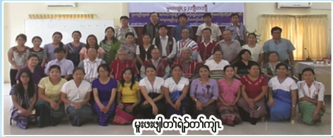
မုၢ်ဖျဲတံးတံးကျဲ

ပုၤကညိဘျးထံခဝုၣ်န့ၢ် လံာ်လံာ်ဒီးတံးဆဲးတံးလၢဝဲကျဲ ၃၉၆, ဘိၣ်ခူဒီးအိၣ်ဆါကျဲ, လါမတီၣ်, ဝုၣ်တက့ၢ် Email : kbc 1913@gmail.com Ph : 24899 (ext 116)